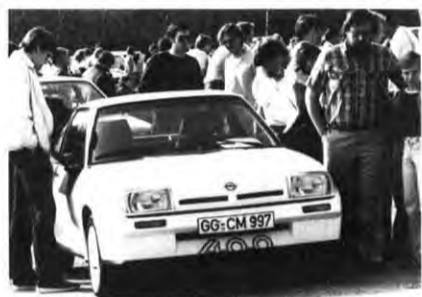
Der Manta 400 fand bei der Sonder-schau reges Interesse.

Für einen umgefahrenen Pylon wurden ihm 3 Strafsekunden angerechnet, die ihn dann auch um den Sieg brachten. Unser Verkaufsbereich hatte anlässlich der Veranstaltung für interessierte Besucher und insbesondere für unsere Werksangehörigen in einer Sonder-schau unser gesamtes Produktionsprogramm vorgestellt. Besonders reges Interesse fand der Manta 400.