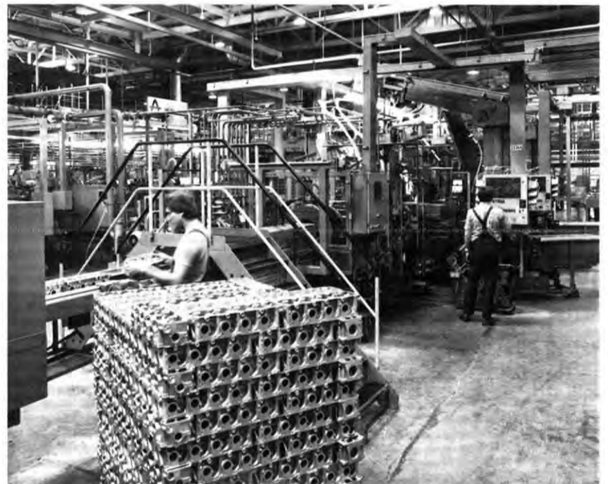
Einer der wichtigsten Bereiche unserer Kaiserslauterner Produktion: der kürzlich in Betrieb genommene Motorenbau.

(Unser Bild zeigt F. Dune mit Meister K. H. Kohl beim Testen einer Wasserpumpe an der Fröhlich-Montage- und Lecktestmaschine.)