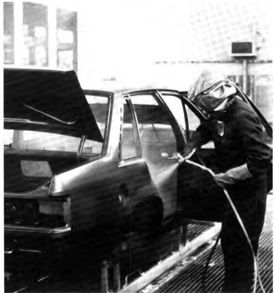
Trotz des Einsatzes von Automaten und Robotern in den Spritzkabinen der neuen Lackiererei in unserem Werk Rüsselsheim fallen noch verschiedene manuelle Lackierarbeiten an. Dabei werden diese Arbeitsplätze mit bis zu sechsfachem Frischluftwechsel pro Minute versorgt, der über eine horizontale Filterdecke vollzogen wird. Anfallender Lacknebel wird nach unten gedrückt und schlägt sich im Wasser der Bodenwanne nieder.

Buchausleihen unserer Rüsselsheimer Werkbücherei. Übrigens: Jetzt vor den Ferien ist es ratsam, sich rechtzeitig mit Lektüre einzudecken. Sprach- und Reiseführer vieler Länder dienen der Urlaubsvorbereitung. Und ein großes Angebot an Unterhaltungsliteratur (Romane, Biographien, Krimis u.s.w.) hilft mit, sich zu entspannen. Aber: nicht lange warten! Wer zuerst kommt, hat die größte Auswahl.