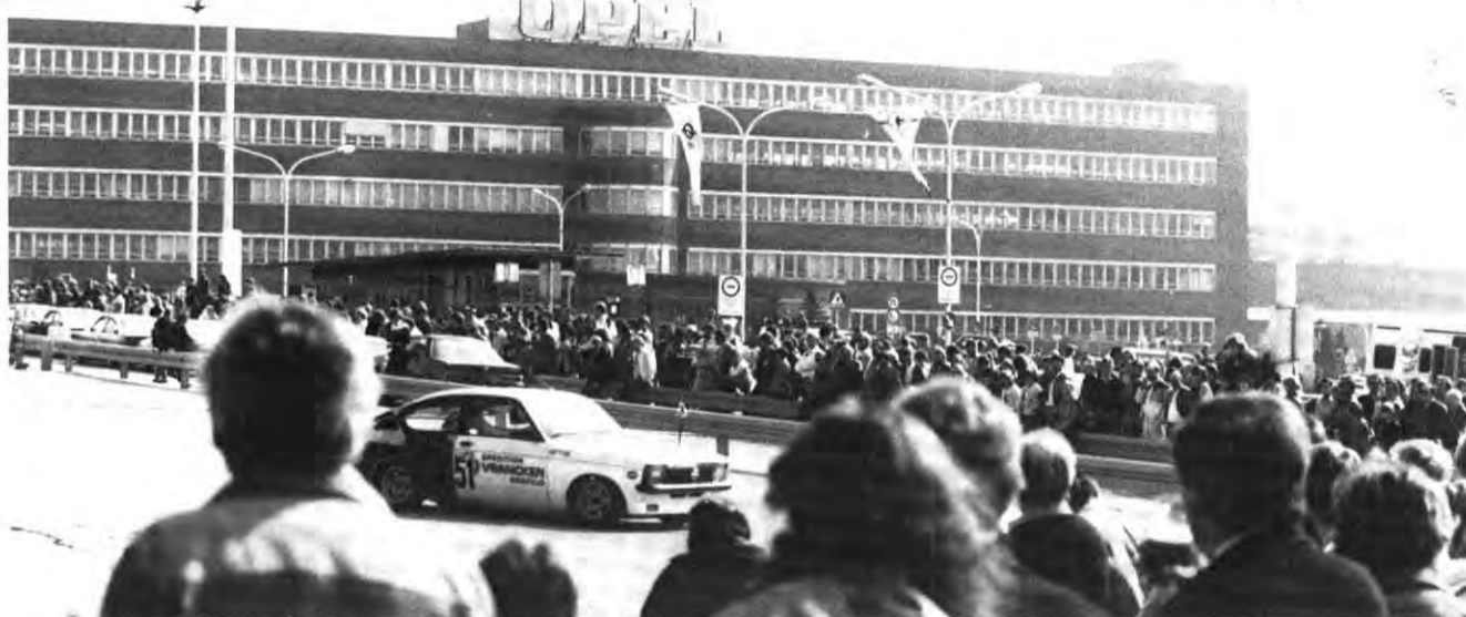
Vor unseren Toren: die gut besuchte „Rennveranstaltung“.