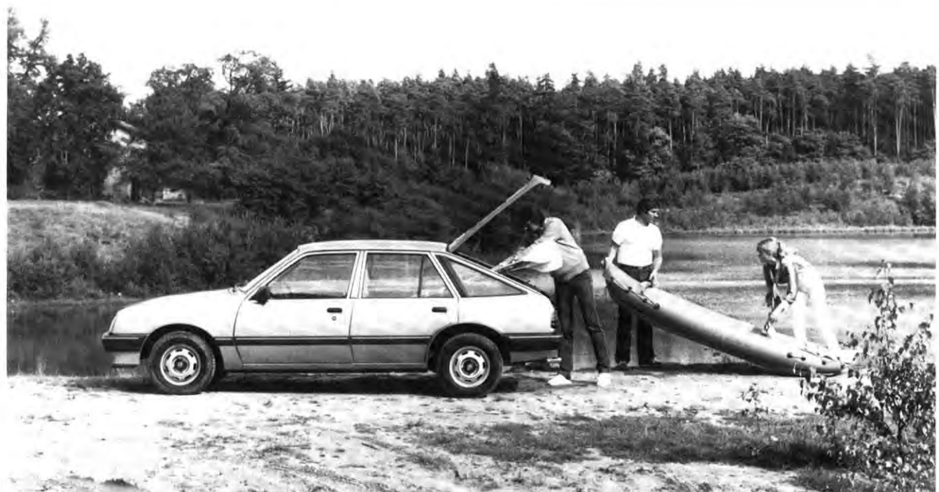
Fahrt zum Wassersport auf einem der nahen Baggerseen: eine beliebte Freizeitaktivität vieler Mitarbeiter unserer drei Werke. Wie man sieht, leistet der ASCONA dabei gute Dienste.

Schon wieder ein Jubiläum! Nach dem Produktionsrekord des Kadett D, über den wir in der letzten Ausgabe berichtet haben (die 1979 vorgestellte neue Modellgeneration erreichte bekanntlich bereits im März '82 eine Million Einheiten), kann jetzt die Rekordmarke von 6 Millionen Kadett-Fahrzeugen seit Aufnahme der Produktion dieses Modells im Sommer 1962 gemeldet werden. Ein großartiger Erfolg! Verständlich, denn in jedem neuen Kadett steckt die Erfahrung von inzwischen 6 Millionen produzierten Fahrzeugen. Die Zuverlässigkeit und Langlebigkeit der Kadett-Familie ist sprichwörtlich: Opel-Qualität ist Langzeit-Qualität. Und die Opel-Wirtschaftlichkeit macht das Autofahren auch langfristig erschwinglich. Seinen vielen Vorzügen verdankt der Opel-Kadett auch, daß er 1981 der meistverkaufte Benziner Deutschlands war.