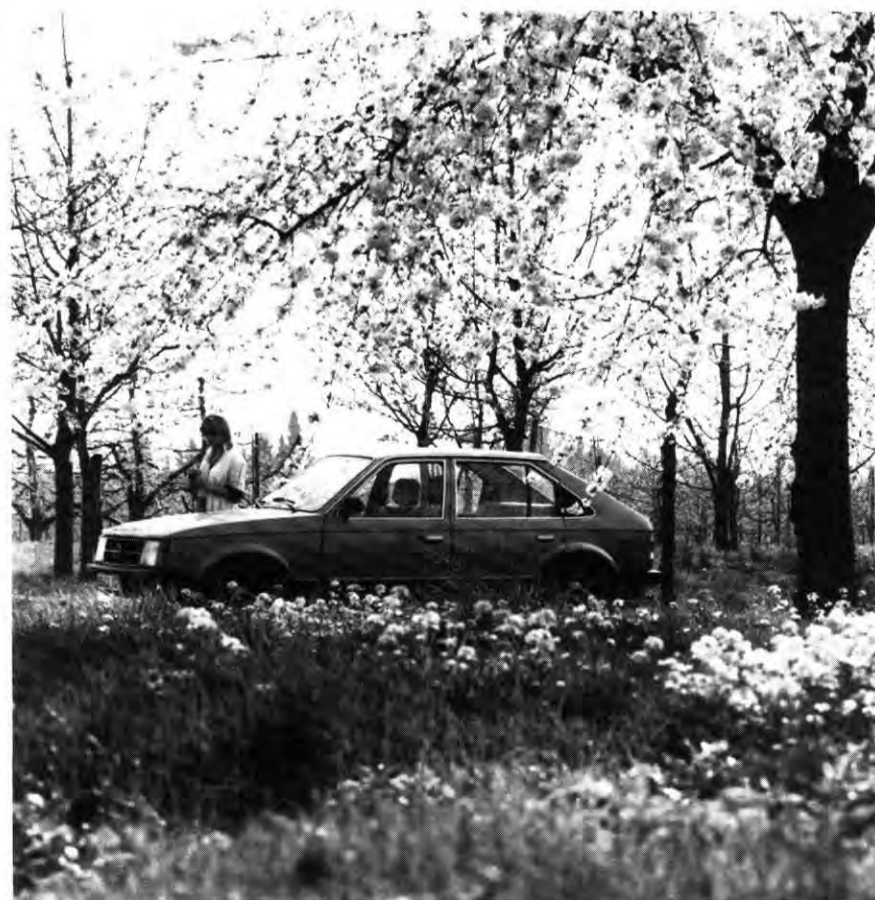
Fahrt in den Frühling. (Schade, daß das Foto mit seinen vielen bunten Tupfern nicht in Farbe gezeigt werden kann.)

Ausstellen kann man sein Fahrzeug an jedem Samstag während der nächsten Monate in den einzelnen Werken auf folgenden Parkplätzen: Werk Rüsselsheim: Parkplatz vor dem Bau K 65 (Teile und Zubehör), Mainzer Straße. – Werk Bochum: Parkplatz vor dem Portal D 4 an der Wittener Straße. – Werk Kaiserslautern: Parkplatz beim Hauptportal am Opel-Kreisel. Die erste Jahreswagen-Börse findet am 5. Juni 1982 statt. Einzelheiten auf den Aushängen, die in den nächsten Tagen an den „Schwarzen Brettern“ erscheinen.