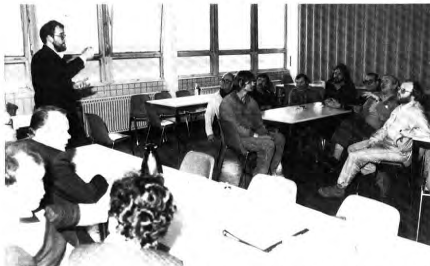
Versammlung der Gehörlosen. Der Dolmetscher (links stehend) sorgt für die notwendige Verständigung.

Als gravierendes Problem wurden die Kontaktschwierigkeiten mit Nichtbehinderten genannt. Daraus erwuchs der Wunsch, möglichst mit mehreren Gehörlosen in einer Abteilung zu arbeiten. Wenn auch nicht für alle Probleme sofort eine Lösung gefunden werden kann, darf die Zusammenkunft dieses Personenkreises doch als eine gute Sache gewertet werden.