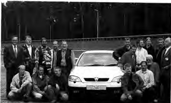
Zeitungslesen lohnt sich: Begeisterte Ausflügler im Testzentrum

Das besondere Schmankekerl war zum Schluß die rasante Reise mit den Testfahrern, die nachhaltig Eindruck hinterließ. Fazit der Beteiligten: Dudenhofen war die Reise wert.