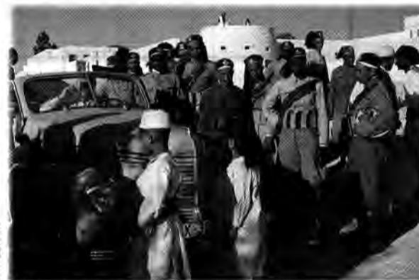
Härtest: Vielbestaunte Abfahrt in Kalut bei 38 Grad