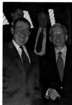
Zu Gast: GM-Boß Jack Smith