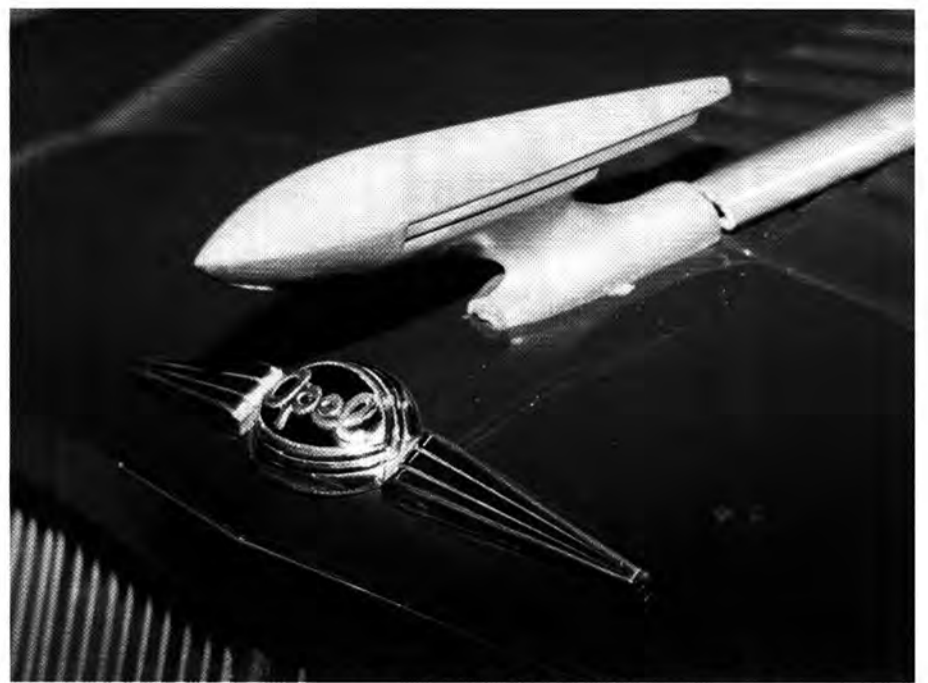
Blitzlos: Den Olympia zierte als Hauben-Schmuck neben dem Opel-Schriftzug ein Zepplin

sorgte ebenso für Aufregung. Die bis dahin übliche Unterteilung in Fahrgestell, auf welches die Karosserie aufgesetzt wurde, war hinfällig. Auch auf die bis dahin übliche Holz/Stahl-Gemischtbauweise wurde nun verzichtet. „Das Gerippe besteht aus Profilträgern, die wie im Metallflugzeugbau miteinander verbunden sind“, erklärte Opel das Konstruktionsgeheimnis. Das machte den Wagen stabiler und leichter, was für eine bessere Wirtschaftlichkeit sorgte und bessere Fahrleistungen bei gleicher Anzahl der Pferdestärken bedeutete. Nur 835 Kilogramm brachte der „Olympia“ auf die Waage. Wurde vorher ein Wagen komplettiert, indem Aufbau und Chassis verschraubt wurden, konnte jetzt „Hochzeit“