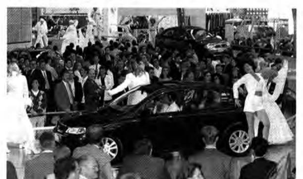
Astra Vagance: Eine künstlerische Hundertschaft setzte den...