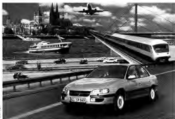
MoTiV: Alle Transportmittel sollen sinnvoll eingebunden werden

Ein weiteres Teilprojekt ist der „persönliche Reiseassistent“, ein neuartiges Informations- und Kommunikati-