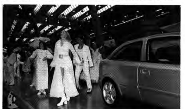
...neuen Astra 14 Mal pro Messetag atemberaubend in Szene