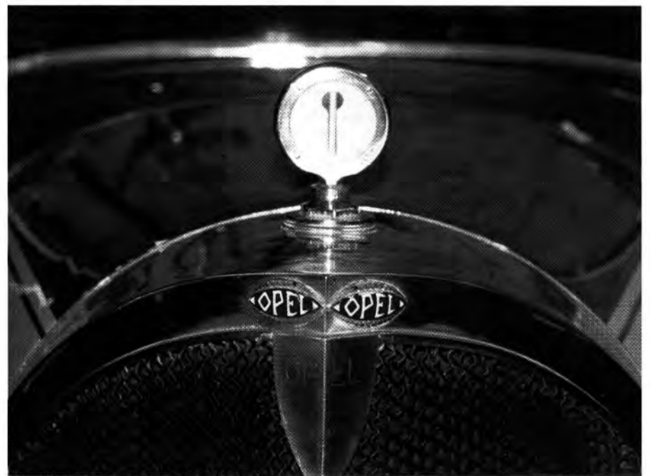
Pfiffige Detaillösung à la Rüsselsheim: Die Kühlerfigur beinhaltet eine Wasserstandsanzeige