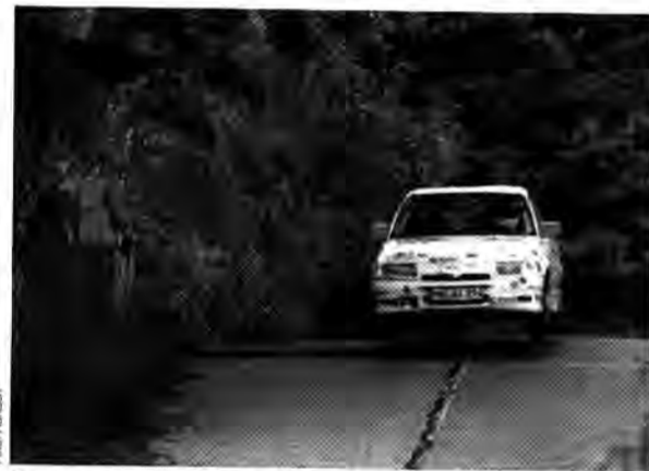
Kommt ein Opel geflogen: Für erste Plätze reichte es aber nicht

Der große Preis der Opel-Werke Bochum stand im Mittelpunkt der nationalen Rallye Ruhrgebiet, die erneut zu großen Teilen auf dem Werksgelände ausgetragen wurde.