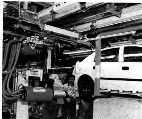
Ran und weg: Kaum hat der Neue Räder, rollt er um den Globus

Und da das neue Modell letztendlich keine „Geheimsache“ bleiben soll, machen die Marketing-Fachleute den späteren Kunden Appetit auf den neuen Astra. Dazu brauchen sie natürlich Anschauungsmaterial, das für sich selbst spricht - einen T 3000 aus Bochum.