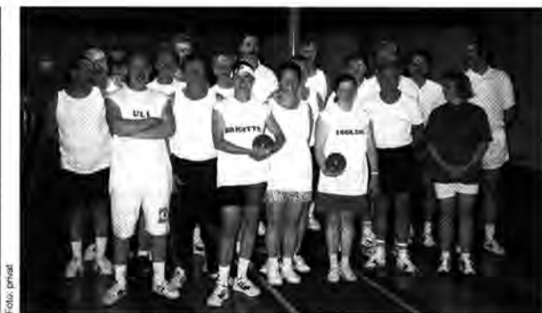
Nicht aus der Bahn zu werfen: Die Opel-Kegler in der Pfalz

Über weite Strecken des Wettkampfes sah es so aus, als könnten die Rüsselsheimer diesmal tatsächlich niedergerungen werden. Aber in einem spannenden Finish