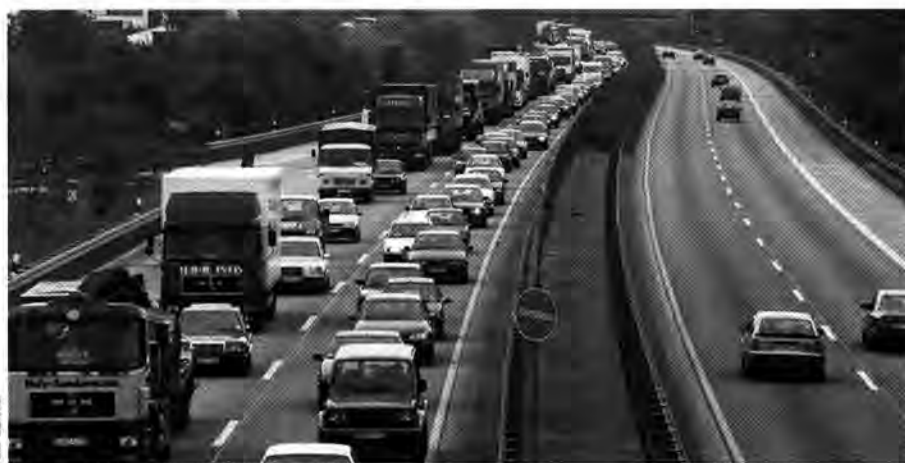
Im Westen was Neues: Der Fahrzeugbestand nimmt weiter zu – im Westen stärker als im Osten

Hinzu kommen in den kreisfreien Städten laut DST noch 659 000 Lastwagen und rund 598 000 Mofas und Motorräder.