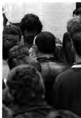
Belagert: Reinhold Messner