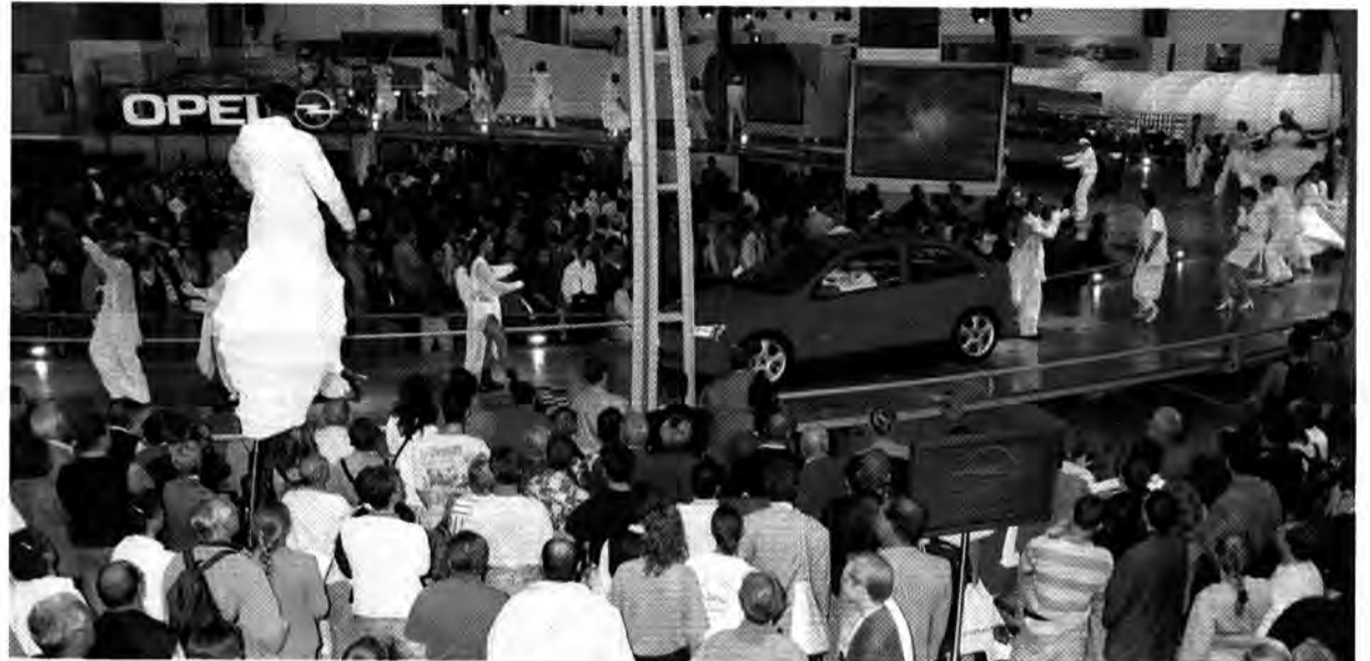
Einstimmig: Publikum und Messe-Experten bewerteten den Opel-Stand samt Astrashow als absolutes Highlight der 97er IAA

„Mal halte ich den Leuten den Spiegel vor, kopiere sie, oder ich bin einfach der Clown, über den sie lachen können.“ Die Wirkung des studierten „Mimmen“ spricht wortlos für sich: Einmal so eingespannt, ist die richtige Stimmung ge-