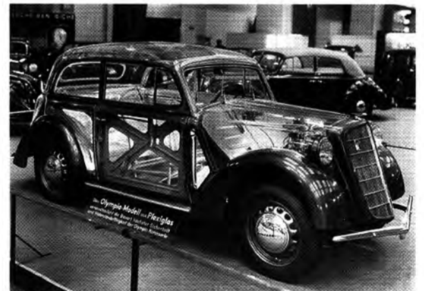
Fortschritt: Ab '35 kommt die selbsttragende Karosserie zum Zug

Wie von einem anderen Stern wirkt die 1935 präsentierte Olympia-Baureihe, das erste deutsche Großserienfahrzeug mit selbsttragender Karosserie. Die Vorteile: geringeres Gewicht, bessere Fahrleistungen, weniger Verbrauch, erhöhte Sicherheit. 168 875 „Olympioniken“ rollen bis zur Produktionseinstellung 1940 vom Band.