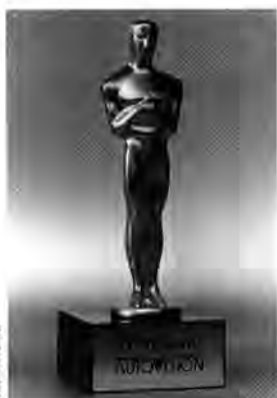
Rekord: '97 gab's 6 Ottocars