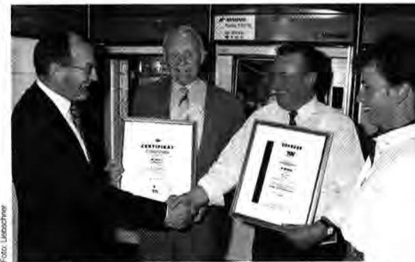
Dickes Lob: Die Rüsselsheimer blieben ohne Abweichung

„Die Zertifizierung durch den TÜV ist die offizielle Bestätigung unseres Engagements in Sachen Qualität und beweist die gute Zusammenarbeit mit Opel“, freut sich