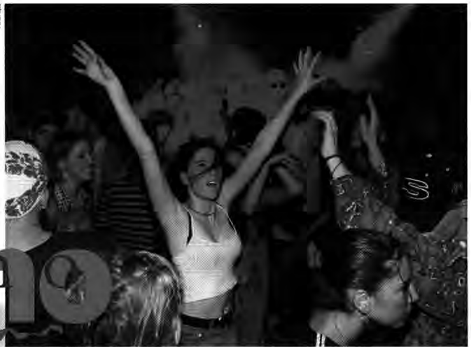
Wochenend und Laserschein: Techno ist schwer in, Ecstasy-Autofahrten sollten aber out bleiben

Dabei handelt es sich um eine synthetische Droge, die stimulierend wirkt. Ecstasy stärkt das Selbstbewußtsein sowie die Kontakt-, Empfindungs- und Bewegungsfähig-