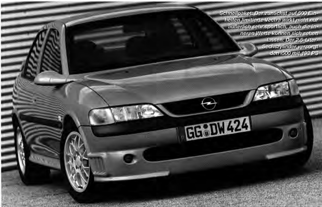
Schnellpaket: Der zunächst auf 500 Einheiten limitierte Vectra wirkt nicht nur äußerlich sehr sportlich, auch die inneren Werte können sich sehen lassen. Der 2,5-Liter-Sechszylinder versorgt den i500 mit 193 PS

Die auffälligsten optischen Erkennungsmerkmale sind ein um 25 Millimeter abgesenktes Sportfahrwerk und eine Frontschürze. Seitliche Türschweller unterstreichen darüber hinaus den unverwechselbaren Auftritt des Vectra i500. Weiteres Highlight: Das Spezialmodell ist mit Reifen der Dimension 215/45x17 auf 7,5 x 17-Zoll-Leichtmetallfel-