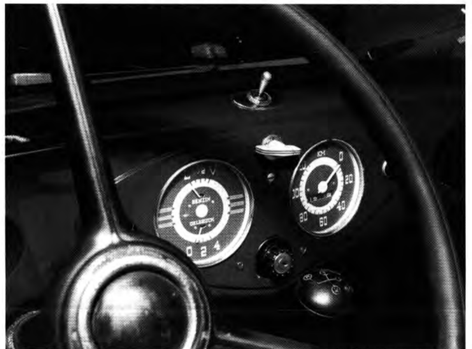
Alles komplett: Zur Ausstattung gehörte auch der Blinkerhebel auf dem Armaturenbrett