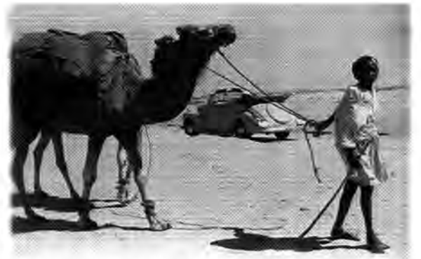
Nur Sand unterm Kiel: Der Kapitän in der libyschen Wüste

mit ihren Kamelen, Soldaten und jede Menge Kinder. Das Quecksilber zeigt 38 Grad um 10 Uhr morgens. Nahezu 350 Kilometer Wüstenstrecke liegen vor uns, zwei Oasen, eine Wasserstelle.“ Am Ende wird der Zielort Gadames nach siebenstündiger Nonstopfahrt erreicht – bei 49 Grad im Schatten. Die Besatzung ist total erschöpft, die Fahrzeuge haben sich wacker gehalten. Bei der Zahl 12 198 bleibt der Kilometerzähler stehen, als die Motoren beider