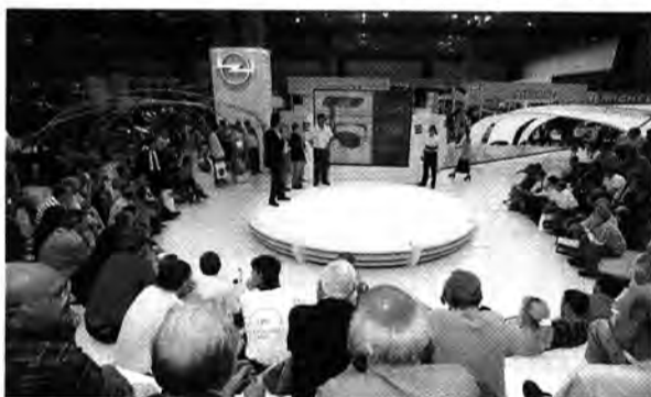
Opel-Forum: Eine Bühne für Fragen zu Produkt und Zubehör