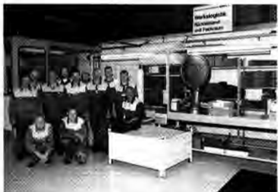
Streicherchor: Die Rückversender

Trott“ zurückfallen wollen. „Es wäre schön, wenn der Funke auch auf andere Abteilungen überspringt, denn es hat sich gezeigt, daß die Renovierung in Eigeninitiative zusätzliche Motivation gebracht hat. Und es passieren weniger Fehler, weil alles gut organisiert ist“, lobt der Meister. Zur „Einweihung“ der blitzsauberen Umgebung gab es Kaffee und Kuchen für alle.