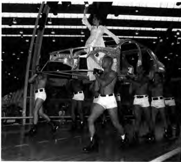
Profis am Werk: Tanz und Gesang rund um den neuen Astra

schaffen für die „Hauptattraktion auf dem Opel-Stand: die „Astra Vagance“.