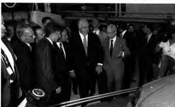
Vollverzinkt: Der Kanzler interessierte sich für den neuen Astra