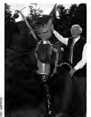
Kunst: Lang'sches Tierleben

Vor einigen Jahren entdeckte er dann seine künstlerische Ader – begann „so ziemlich alles, was die Leute wegwerfen“, zu Kunstwerken zusammensetzen. Spät, aber längst nicht zu spät. Denn auch mit 67 ist noch lange nicht Schluß.