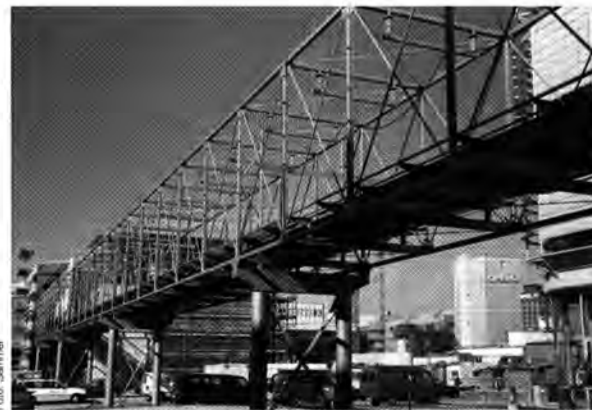
Opel hat schon viele Brücken in andere Kontinente und Kulturen geschlagen – jetzt war auch mal eine im Werk fällig. Doch auch die ist gewaltig: 125 Meter lang ist die Fußgängerbrücke, die künftig die neue Unternehmenszentrale und das derzeit entstehende Besucherzentrum Opel live verbindet. Die Konstruktion der Aluminium-Brücke dauerte drei Wochen. Sie besteht aus fünf Segmenten, die jeweils zehn Tonnen schwer sind, und ruht auf sechs Stützen. Die Fenster können elektronisch geöffnet und geschlossen werden.

Übrigens: Die Tafeln können von interessierten Bereichen gern ausgeliehen werden. Anfragen nimmt Uwe Landau, Telefon 0 61 42/66 20 31, entgegen.