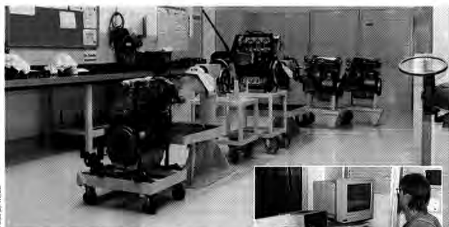
Motorroller: Triebwerke beim Computer-Check

Den Motorenprüfständen sind weitere Einheiten wie Diesel-Pumpen- beziehungsweise -Düsenprüfbänke angegliedert. „Wir arbeiten auf dem Diesel- und Benziner-Sektor“, führt Wagner weiter aus. Besondere Vorteile bietet die Ab-